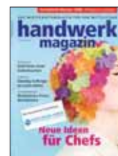
Platz 1 im Sonderheft handwerk magazin 10/2005